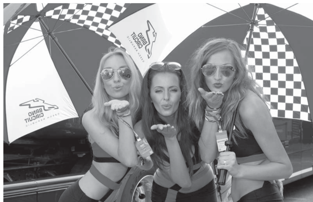
Žádné motocyklové závody se neobejdou bez atraktivních dívek.

ce s Carmelo Ezpeletou, že se Velká cena České republiky bude v Brně jezdít i v dalších pěti letech.