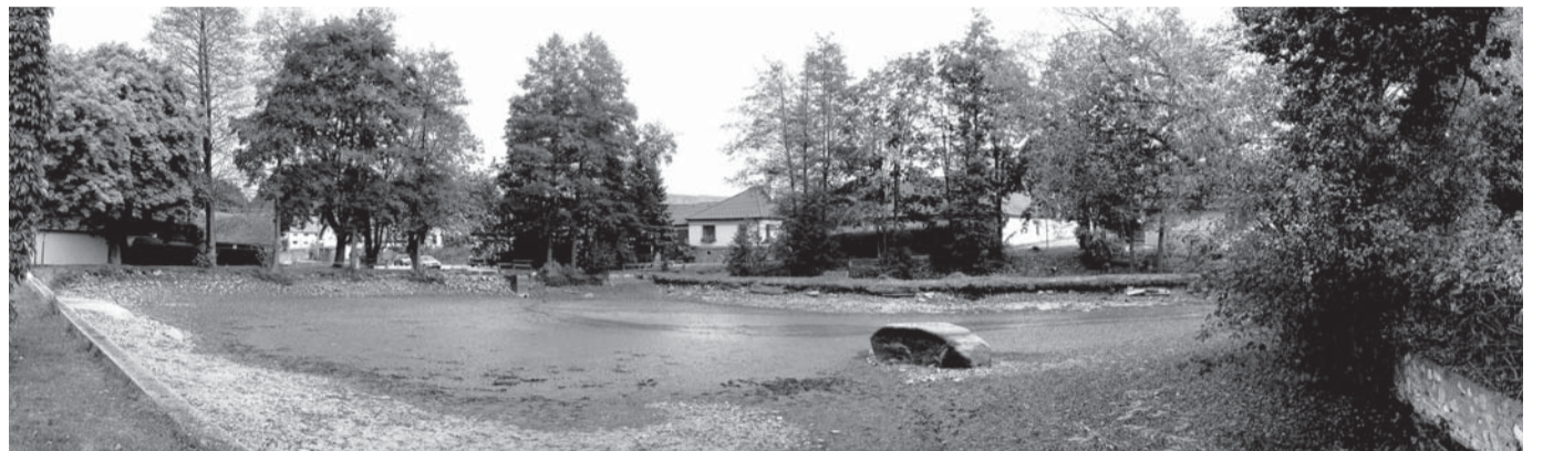
Vypuštěný rybník v dobách tropických veder, kdy je krajina vysušena na troud, překvapil asi každého, kdo jel v tu dobu okolo.

BOCHOVICE (hu) - Hustě prší, stěrače sotva stačí brát nečekaný příděl vody z nízkých mračen na obloze a já jedu do nedalekých Bochovic povídat si se zemědělci o dlouhotrvajícím suchu a jeho důsledcích. Paradox. Nečekané, ale o to vydatnější deště trvají už druhý den. Bude vůbec o čem si povídat? Předem domluvené setkání