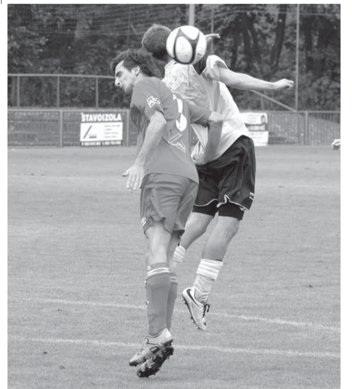
Juniorka trebičského Horického fotbalového klubu (v tmavších dresech) remizovala s Budišovem.

Rokytnice B - Jakubov B 1:3 (0:1). Branky: 49. Štork - 33. Chalupa, 50. Vrbka, 84. Pavea. Rozhodčí Čejka. ŽK: 1:3. Diváků 50.